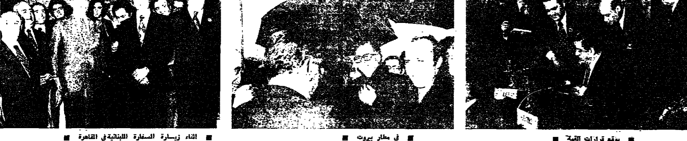
يوقع قرارات القمة في مطار بيروت